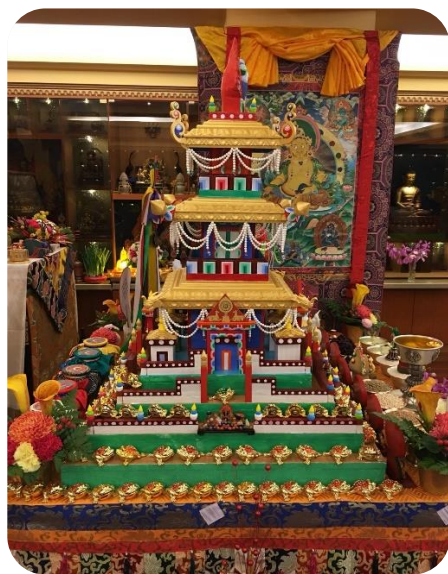
財寶天王竹千大法會壇城