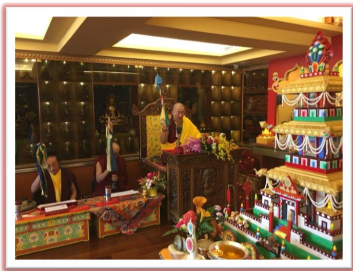
財寶天王竹千大法會修法

法會期間：107/2/18(日) ～ 107/2/24(六)，連續七天修法 每日三座修法：09:30～12:00、14:00～16:00、16:30～18:30