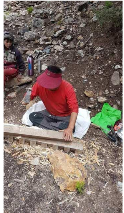
門框上方門楣製作