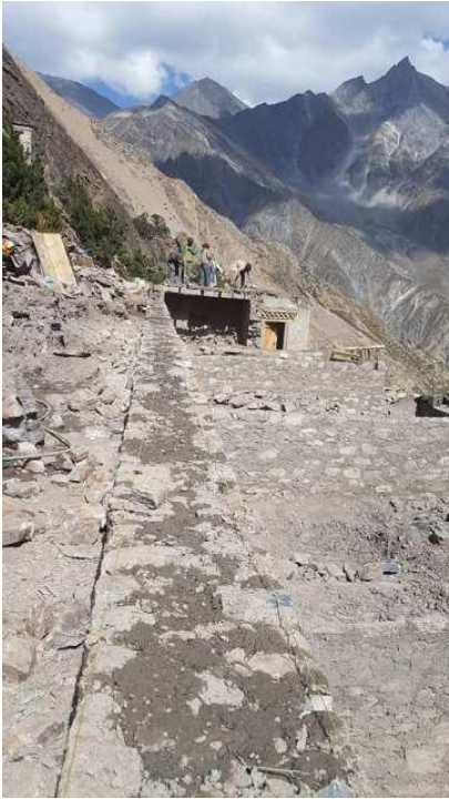
新修建關房的位置

佩服上師的大無畏，佩服喇嘛們的毅力執行力，佩服當地村民如勇父般的猛力協助，佩服所有願意相信的善友大德！