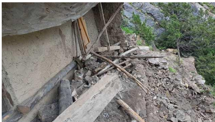
原已完工的四間關房被大石砸毀