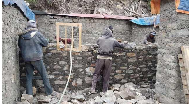
木門框要嵌入牆中