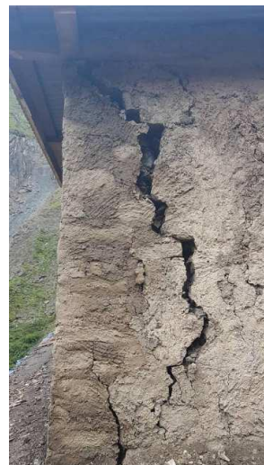
牆壁龜裂毀壞，須重建