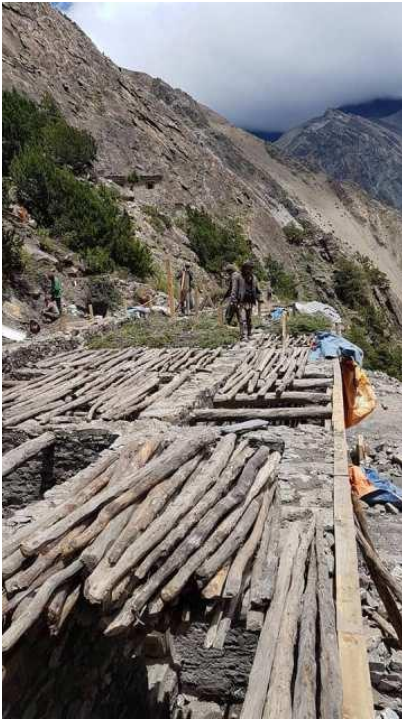
需要的木材準備好