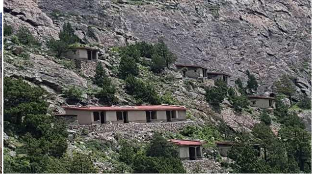
右圖：重建的四間關房