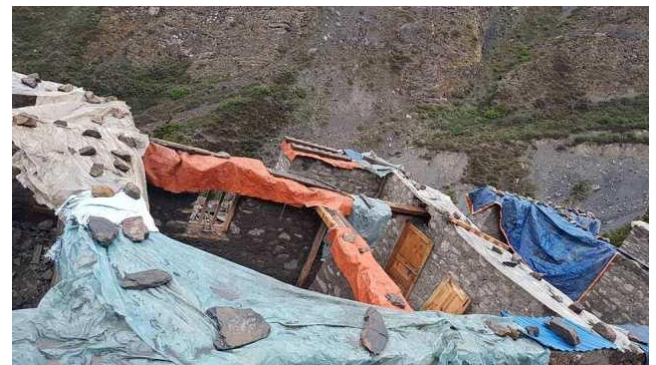
關房重建施工紀錄

註：最後的影片是喇嘛對紅山閉關房的簡介，喇嘛中文表達能力不是很好。 他主要想告訴大家，《紅山》是個美麗的地方，樹木聞起來都很香...歡迎大家來這個美麗的地方看看，能來閉關是最好的！