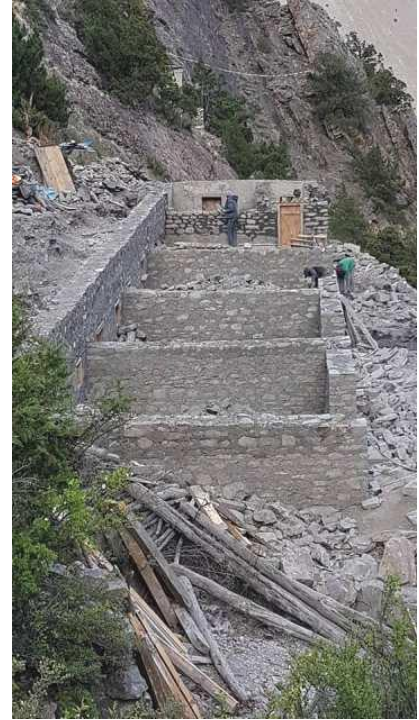
四間重建關房的地基圍牆